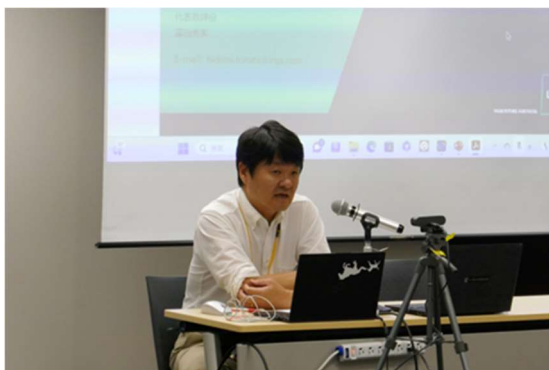
当会委員によるセミナー (8/7)

LRQA サステナビリティ富田氏による基調講演 当会委員によるセミナー (8/1)