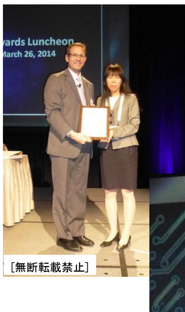
◆IPC President と記念撮影

IPC (Association Connecting Electronics Industries) は、電子機器業界、特にプリント基板設計者、プリント基板製造業者の業界団体です。