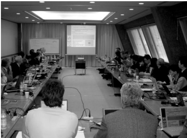
写真 1. SC31京都会議の様子

AIDC : Automatic Identification and Data Capture