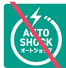
反転させてはならない