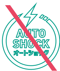
アウトライン化してはならない