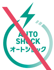
図形と文字のバランスを変更 してはならない