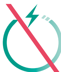
文字を削除してはならない