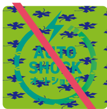
ロゴマークが見えにくい背景の上 (色、模様)に配置してはならない