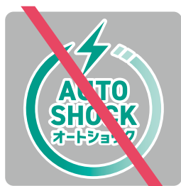
縁取りを追加してはならない