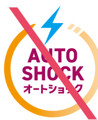
指定色以外を使用してはならない