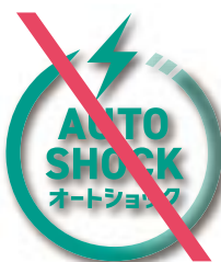
影を付けてはならない