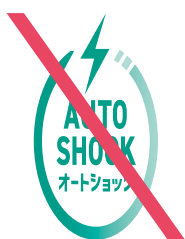
変形してはならない