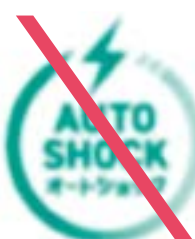
ぼかし等の処理をしてはならない