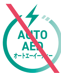
文字を変更してはならない