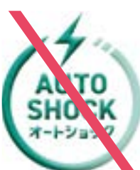
立体化してはならない